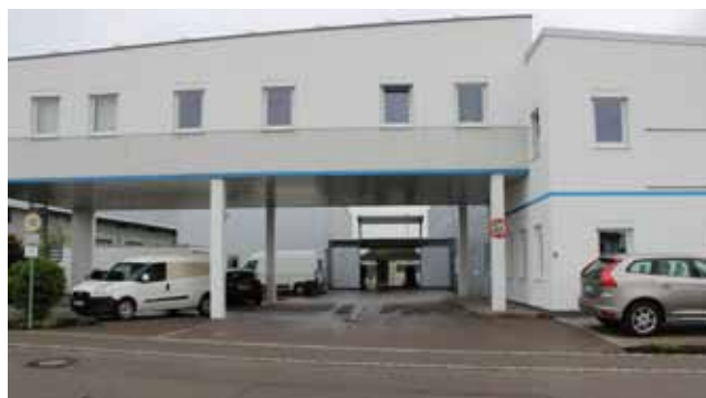
In den vergangenen Jahren wurde die Firmenzentrale in Wertingen mehrfach erweitert, um dadurch größere Kapazitäten zu schaffen.

Zum 30-jährigen Jubiläum hatte die Firma WDT ihre Kunden, Freunde und Geschäftspartner zu den Feierlichkeiten in Wertingen eingeladen. Rund 120 Gäste waren der Einladung gefolgt. Zu Beginn standen ein Firmenrundgang und die Live-Präsentation verschiedener Produkte auf der Agenda. Die Gäste konnten die WDT-Produkte und -Verfahren persönlich in Augenschein nehmen und sich im Gespräch mit den Mitarbeitern Details erläutern lassen.