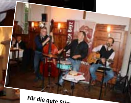
Für die gute Stimmung im Saal sorgte die Band The Village Boyz.