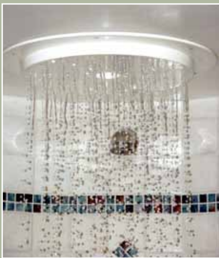
Zwei Beispiele von Erlebnisduschen der Firma SHS Schmierer. Oben: Auf Knopfdruck können zum Wassererlebnis auch noch Licht- und Soundeffekte abgerufen werden. Rechts: Felsengrotte mit Erlebnisduschen und Wasserfällen. ( www.schwimmbad-schmierer.de )

Die Steuerung erfolgt elektronisch, und die Badenden können das gewünschte Programm in der Dusche leicht per Knopfdruck abrufen