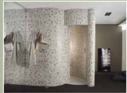
Links: Mit Goldmosaiken ausgekleidete Erlebnisduschen von Klafs, realisiert im exklusiven Wellnessbereich des Hotels Dolder Grand in Zürich. Rechts oben: Erlebnisdusche von Klafs mit Lichtpunkten in der Wand. Darunter: Aufwendig gestaltete Erlebnisdusche von Klafs. Die Wandgestaltung setzt sich in der Dusche fort. ( www.klafs.de )

Die Steuerung erfolgt elektronisch, und die Badenden können das gewünschte Programm in der Dusche leicht per Knopfdruck abrufen