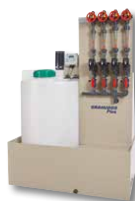
SYSTÈME D'ALIMENTATION POUR GRANUDOS PLUS