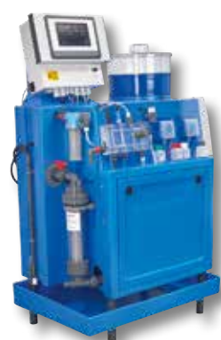
GRANUDOS 10-CPR TOUCH XL**