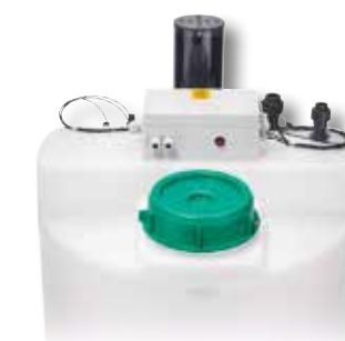
BAC TAMPON GRANUDOS-PB