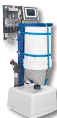
GRANUDOS 45/100-CPR TOUCH XL**