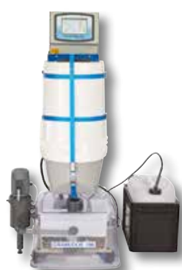
GRANUDOS 45/100-PLUS -V70-TOUCH*