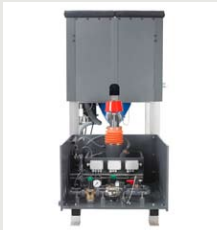
Carodos, Aktivkohledosierung aus Big Bag

4 E 51) und zeigt bewährte Produkte und wesentliche Neuheiten: Die GRANUDOS-Plus Anlage zur Desinfektion von Mehrbeckensystemen mit Chlorgranulat wurde steuertechnisch optimiert. In Zukunft wird die Anlage mit einem 7" Touch Farbdisplay mit intuitiver, graphischer und visueller Bedienung ausgestattet sein. Im Bereich Erlebnisduschen wurden hinterleuchtete Duschdecken entwickelt. Alle für eine Erlebnisdusche relevanten Komponenten sind in den Deckenelementen integriert. Düsen für die Wassereffekte, LED RGB Spots für die Beleuchtung der Kabine. Das Licht der LED Spots wird über eine Acrylglasplatte gebrochen und schafft somit einzigartige Erlebniswelten.