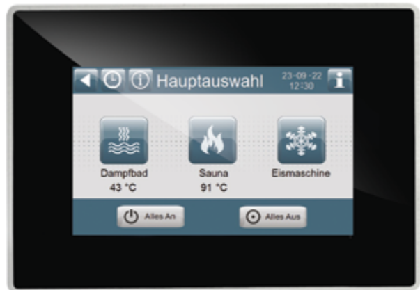
Touch Display, 4,3", 64000 Farben